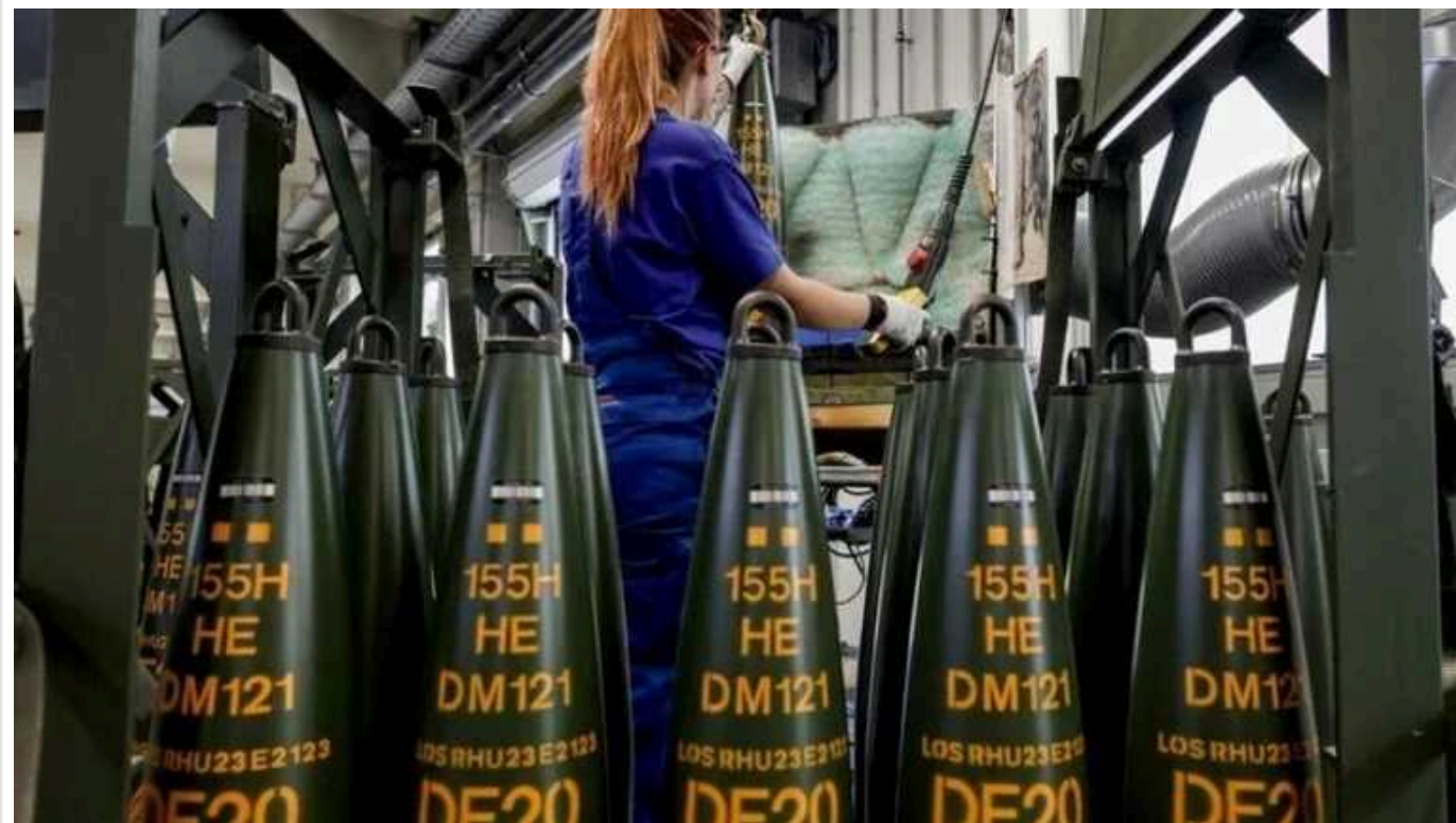
Rheinmetall передасть Україні прототипи артилерійських снарядів дальністю 100 кілометрів

Оборонний концерн Rheinmetall (Німеччина) протягом 2024 року планує поставити Україні "сотні тисяч" артилерійських боєприпасів. Серед них будуть прототипи снарядів із дальністю 100 кілометрів.