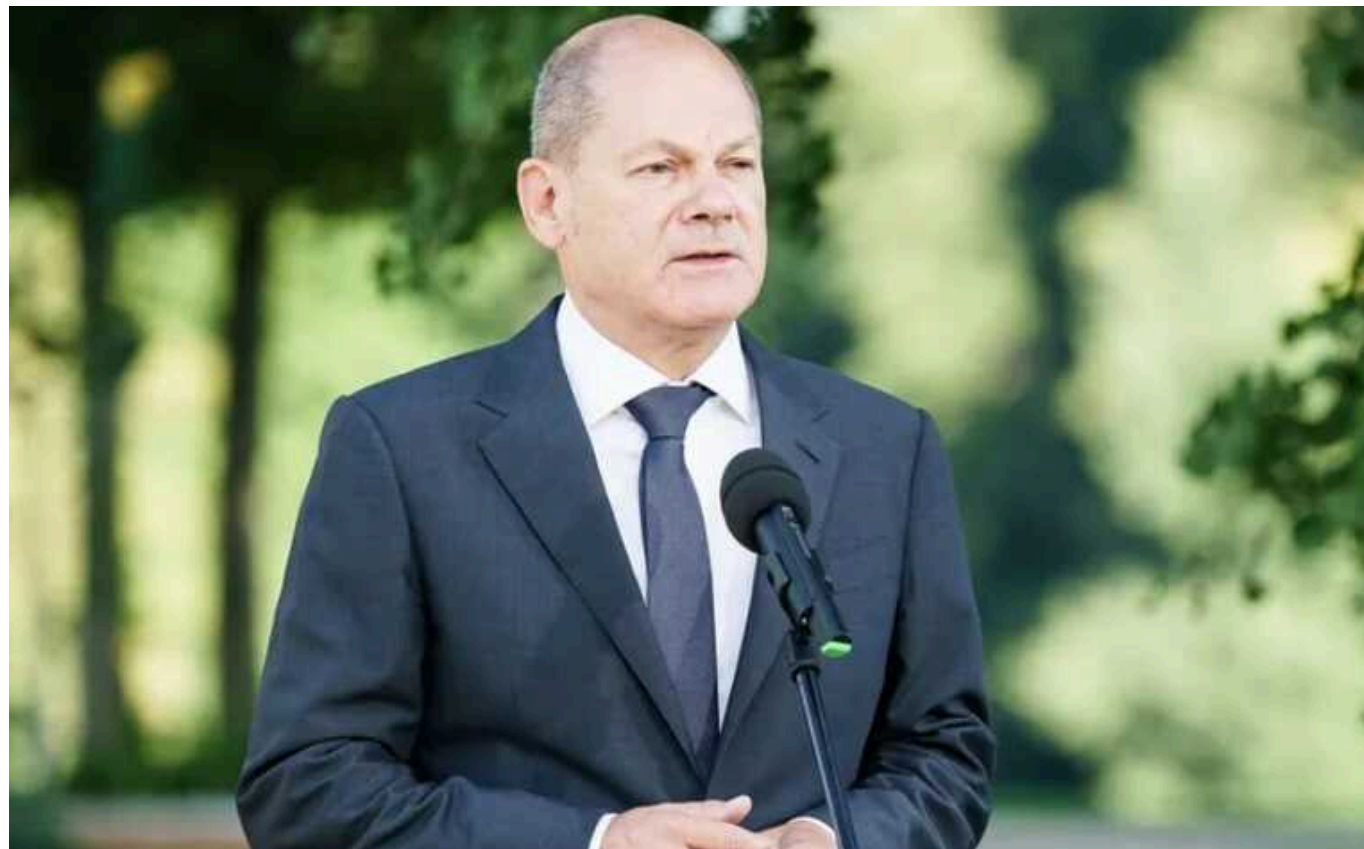
Шольц у Великдень нагадав про підтримку України

Канцлер Німеччини Олаф Шольц у привітанні з Великоднем згадав про повномасштабну війну, яка триває в Україні. Він пообіцяв підтримувати нашу країну "стільки, скільки потрібно".