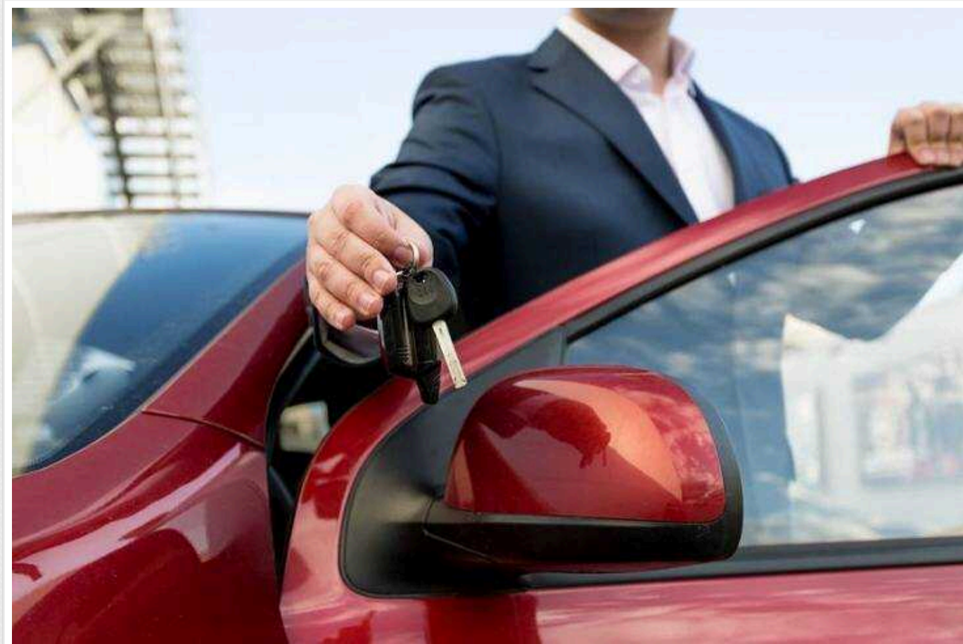
У Києві чоловік здав в оренду свій автомобіль і пізніше виявив його покинутим біля молдавського кордону на Одещині

Вчора в Одесі до поліції звернувся чоловік і повідомив, що, перебуваючи у Києві, здав в оренду свій Ford Fusion 32-річному херсонцю.