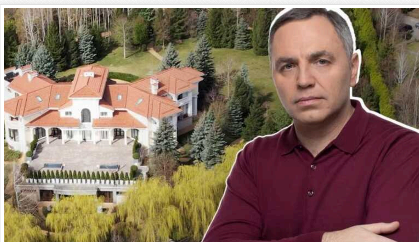
Портнов з Іспанії переписав свою віллу під Києвом на дітей

Проросійський діяч Андрій Портнов, який перебуває під санкціями США та виїхав з України, на початку квітня 2024 року переписав великий маєток під Києвом, у елітному селищі Козин, на своїх дітей.