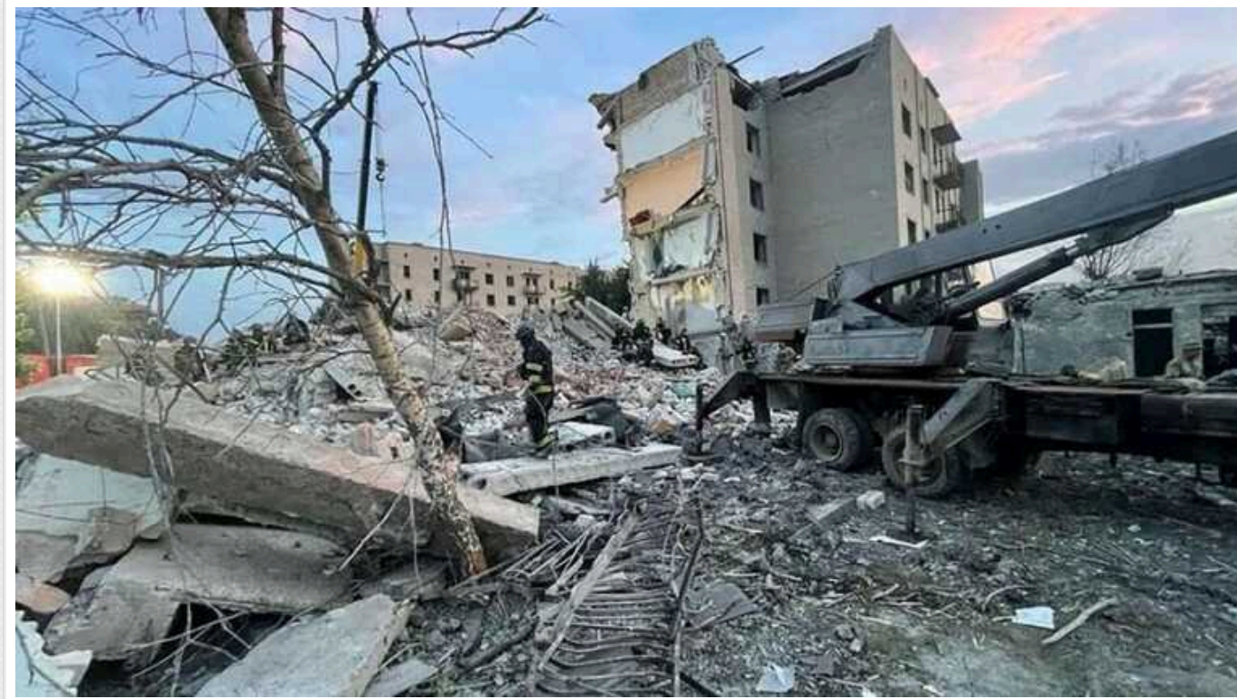
У Часовому Яру, незважаючи на щоденні обстріли окупантів, залишається 681 мешканець

Російська терористична армія продовжує стирати з лиця землі місто Часів Яр у Донецькій області. При цьому в населеному пункті досі залишаються сотні мирних жителів.