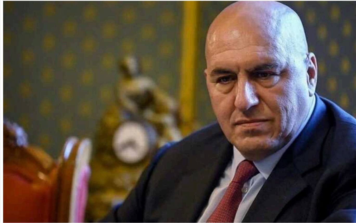
Міністр оборони Італії Гвідо Крозетто звинуватив Макрона у "нагнітанні напруги" у війні в Україні

Італія не відправлятиме війська в Україну і не братиме участі у війні. Подібні заяви президента Франції Еммануеля Макрона нагнітають напругу.