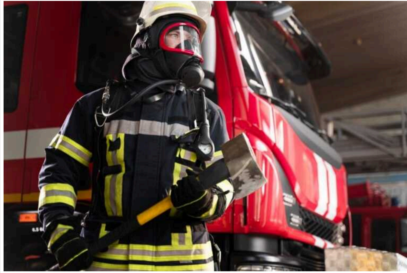
Окупанти вдарили по цивільній інфраструктурі Харкова: є постраждалі

Російські терористи сьогодні, 4 травня, знову обстріляли Харків. Ворожий удар завдав цивільній інфраструктурі.