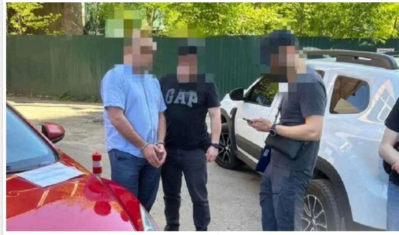
На Київщині викрито директора держпідприємства, який вимагав хабар за розміщення зони відпочинку

Правоохоронці викрили на хабарництві директора одного з держпідприємств Мінінфраструктури. За інформацією слідства, зловмисник вимагав гроші за дозвіл на розміщення зони відпочинку на гідротехнічних спорудах Київщини.