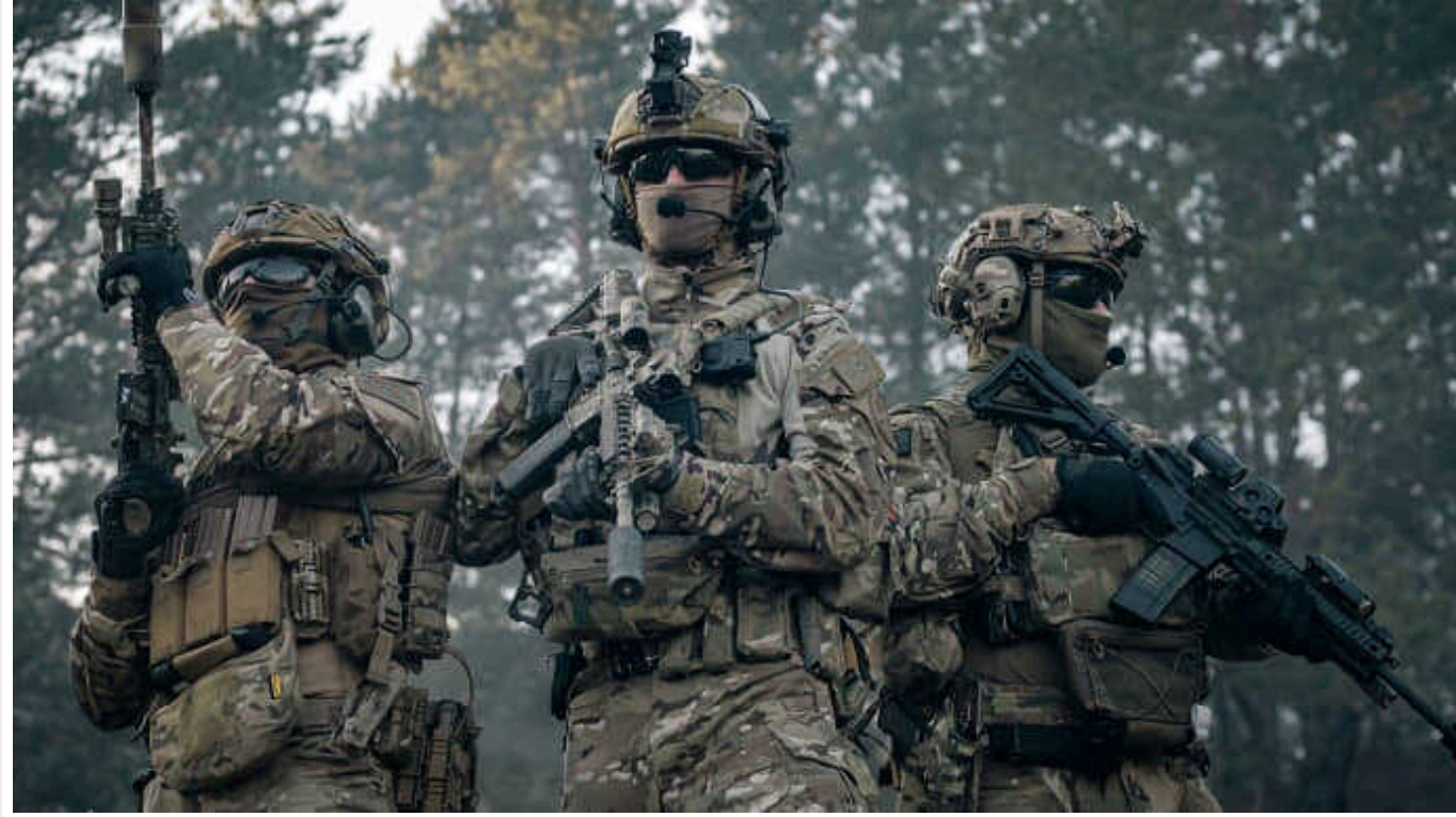
Спецпризначенці СБУ вночі вибуховим дроном дістали групу окупантів «на перекурі»

Сили оборони України показали нове відео роботи FPV-дронів на фронті. Спецпризначенці Служби безпеки використали безпілотник з осколковою бойовою частиною, щоб ударити по живій силі противника.