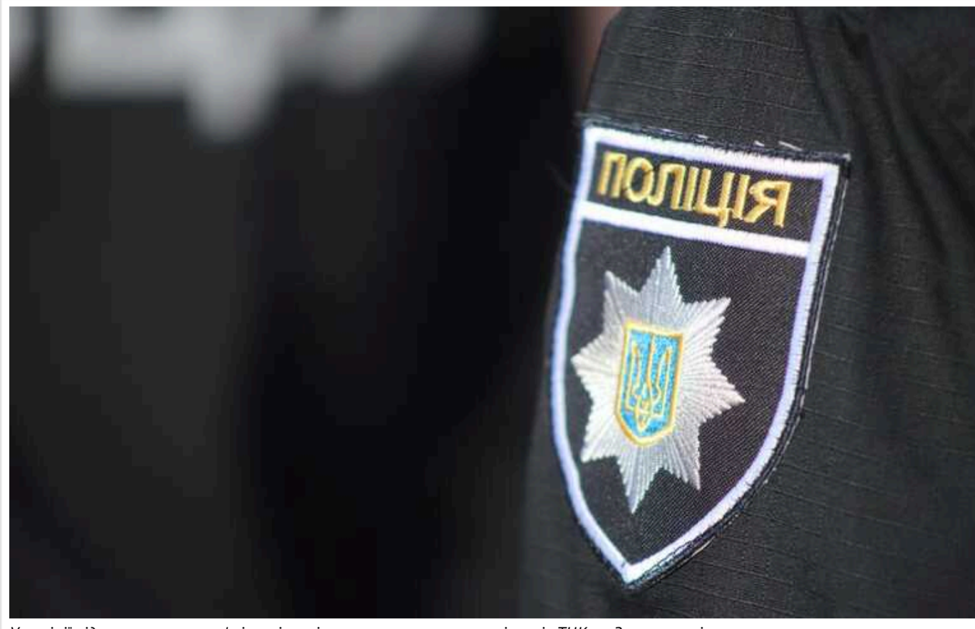
У поліції відреагували на конфлікт зі стріляниною за участю працівників ТЦК на Закарпатті

Поліція проводить розслідування через конфлікт за участю працівників ТЦК та СП на Закарпатті. Працівникам військкомату навіть довелося стріляти у повітря.