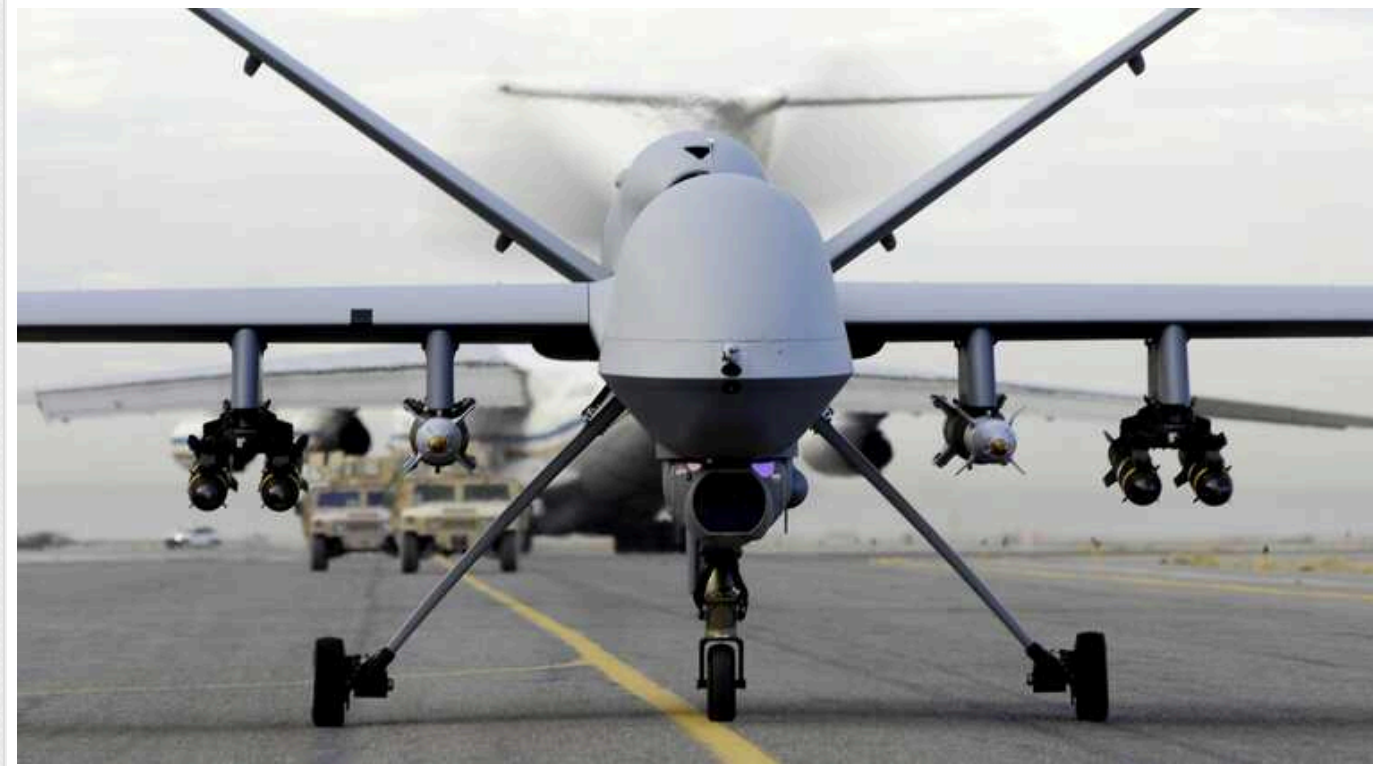
ЗМІ розповіли про пріоритетну зацікавленість Києва у безпілотниках MQ-9 Reaper

Україна все більше зацікавлена в отриманні розвідувального безпілотника MQ-9 Reaper від США, піднявши його на перше місце в списку бажань за останні місяці.