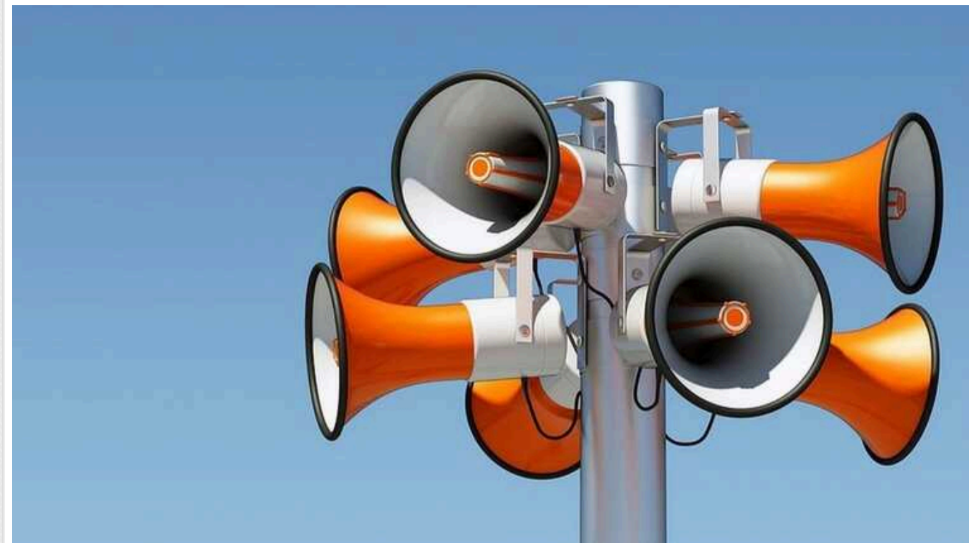
В Україні знову оголошено повітряну тривогу

По всій Україні, ввечері п'ятниці, 3 травня, оголошена масштабна повітряна тривога. Причина - зліт російського МіГ-31К.