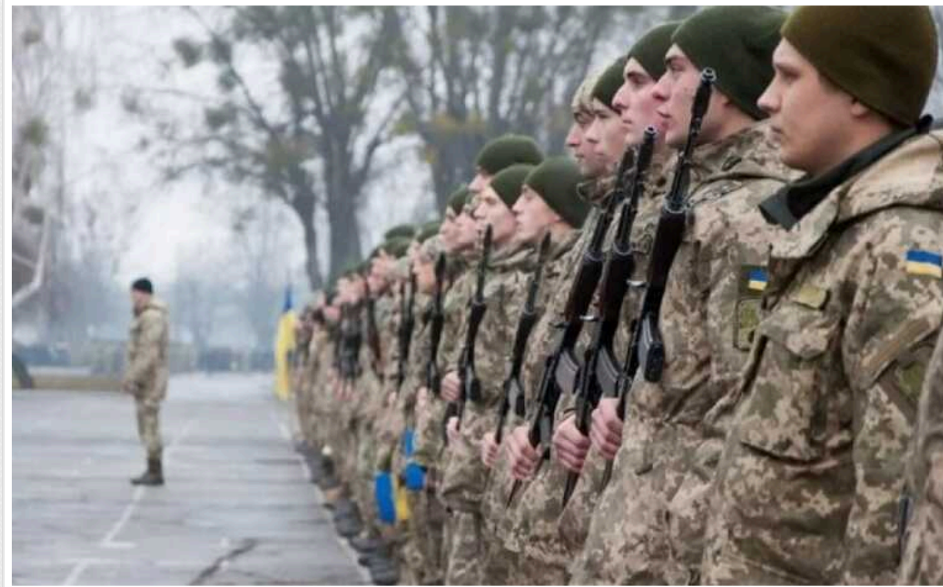
В Україні зберезуть бронь від призову до армії керівникам держорганів та органів місцевого самоврядування

В Україні після набуття чинності новим законом про мобілізацію зберезуть броню від призову до армії 100% чиновників категорії А (керівники держорганів та органів місцевого самоврядування). Також матимуть право на броню половина чиновників категорій Б та В.