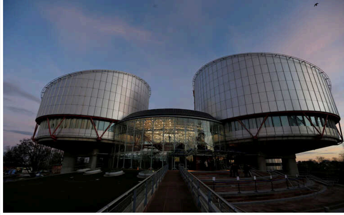
ЄСПЛ призначив слухання щодо російських злочинів на сході України

Європейський суд з прав людини 12 червня розпочне публічні слухання позову «Україна та Нідерланди проти Російської Федерації» щодо порушень прав людини в окупованих частинах Донецької і Луганської областей, а також доєднаного у 2022 році позову щодо повномасштабного вторгнення РФ.