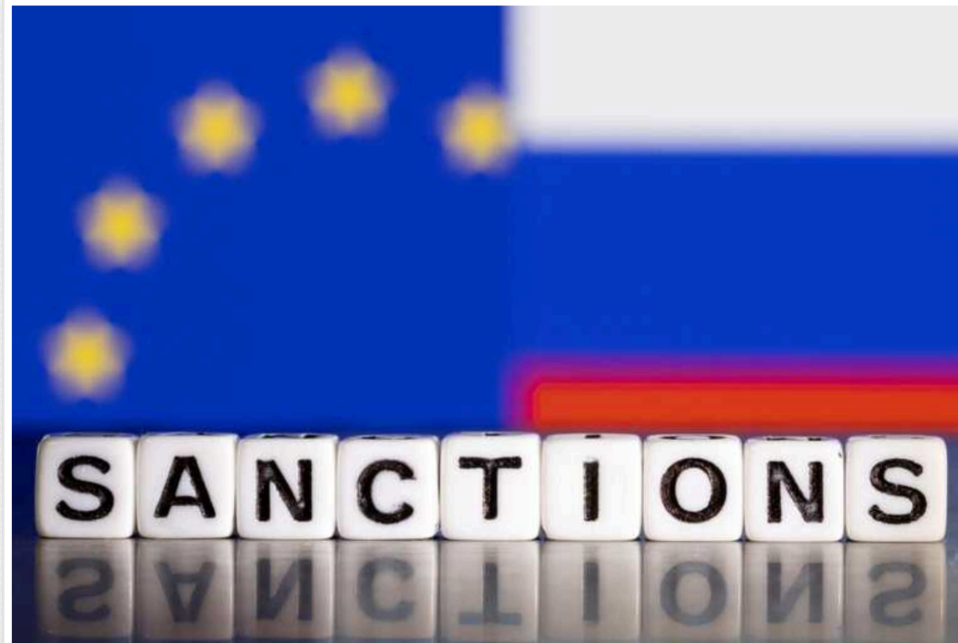
У Латвії запропонували додати у новий пакет санкцій ЄС проти РФ марганцеву руду та оксид алюмінію

Латвія висунула пропозицію до 14-го пакету санкцій Європейського союзу проти Росії - заборонити постачання марганцевої руди та оксиду алюмінію.