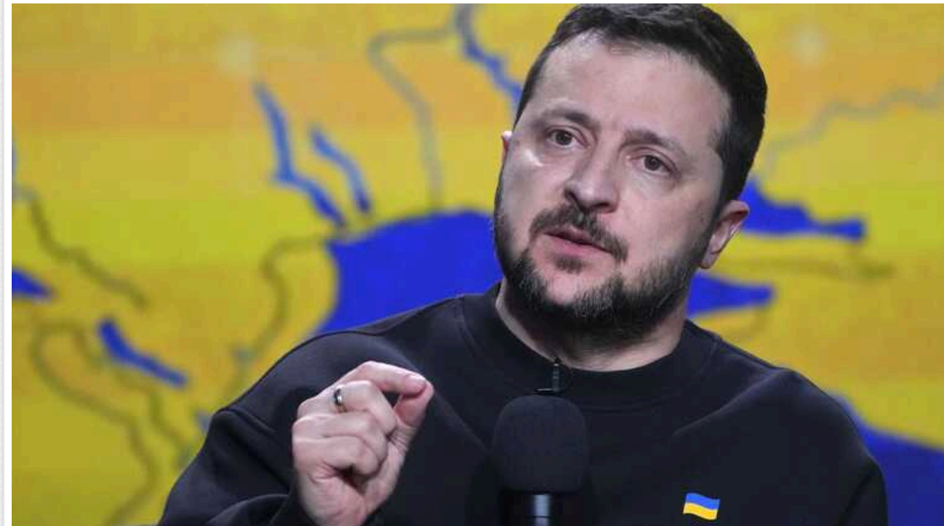
Зеленський сказав, що стримує Путіна від ядерного удару по Україні

Російський диктатор Володимир Путін не наважувється завдати ядерного удару по Україні, адже боїться втратити владу, гроші, а найголовніше - підтримку суспільства.