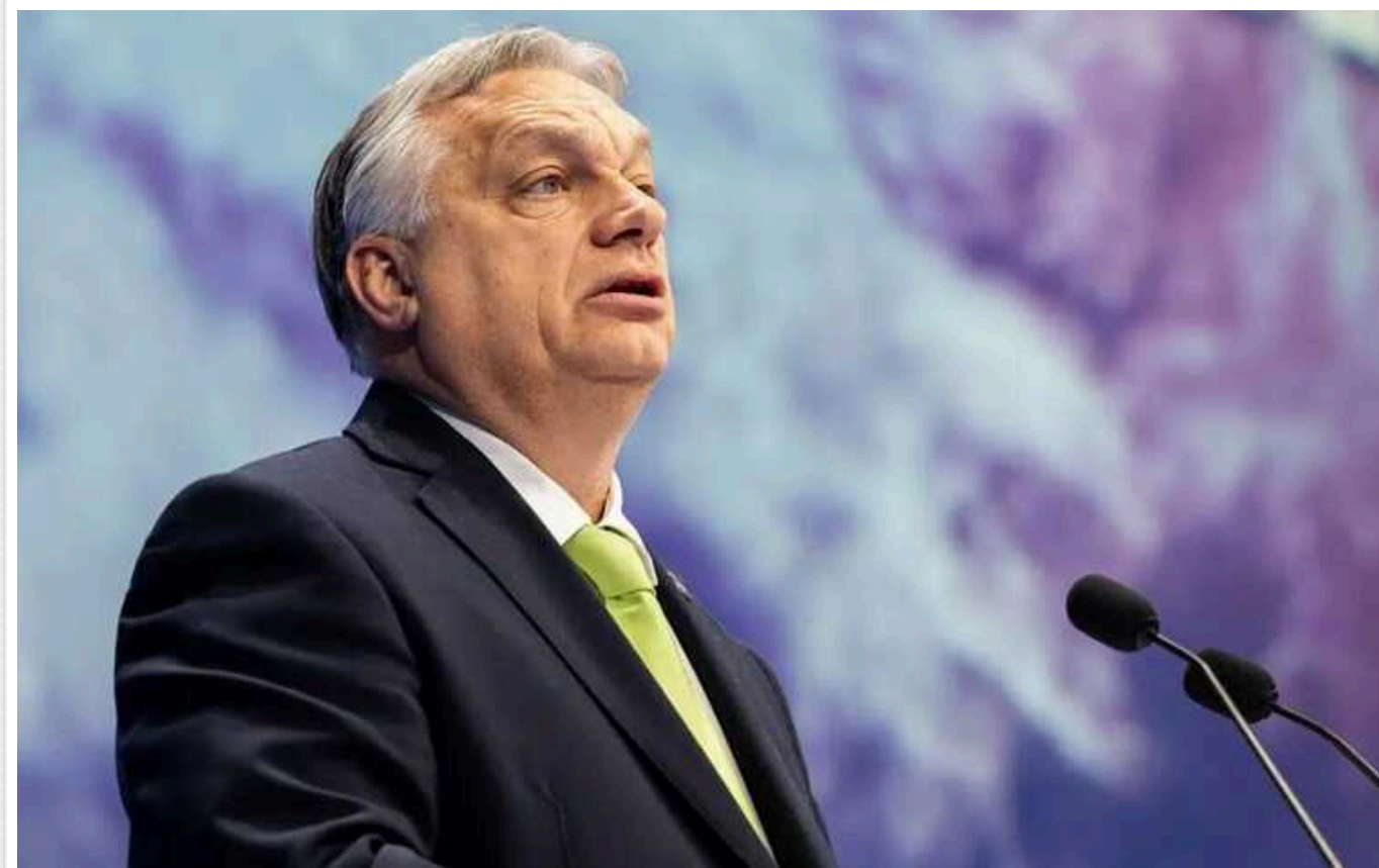
Орбан: Угорцям не доведеться втретє вимушено воювати

У Європі та США при владі перебувають прововенні уряди, вважає Віктор Орбан. На цьому тлі Угорщина, виступаючи за мир, виділяється поміж країн.