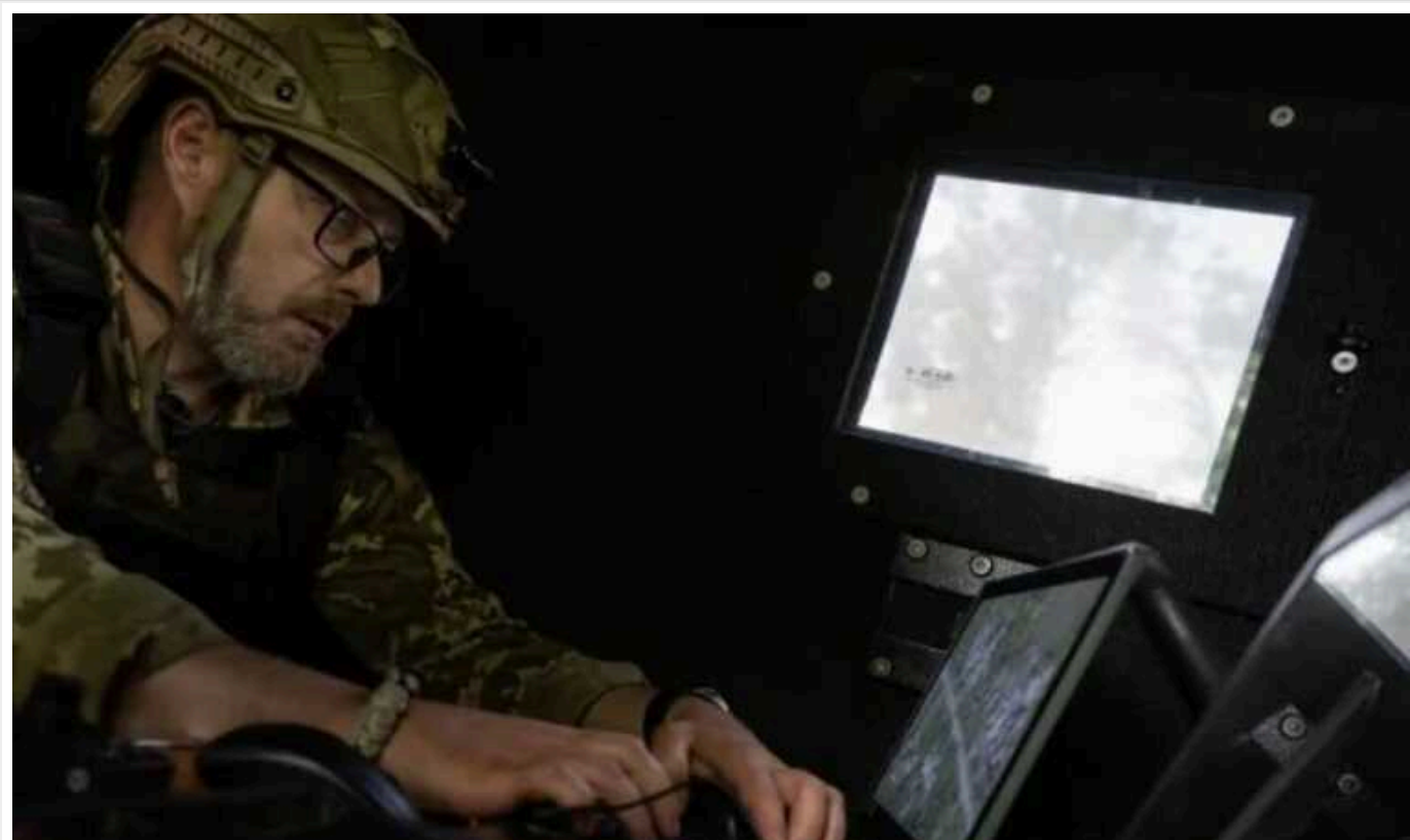
Чому ЗСУ користуються цифровими системами, які не взяли на озброєння

За словами Олександра Феденка, цифрові системи необхідні для збору даних про ворога, координації БПЛА та артилерії. Військові давно щими технологіями, їх досі не прийняли на озброєння.