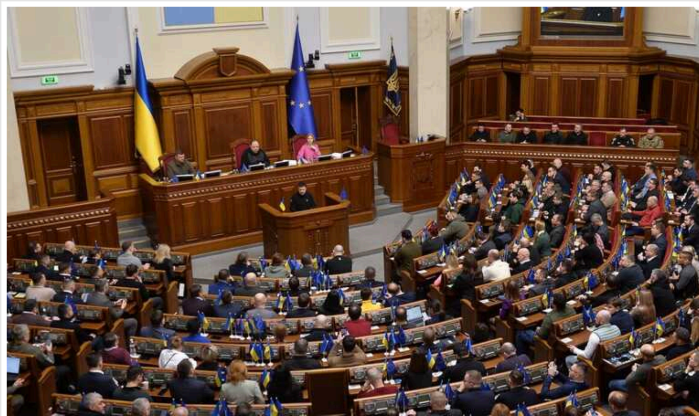
Українців зможуть заочно штрафувати за неявку до ТЦК, - Осадчук

Законопроект про відповідальність за порушення правил військового обліку 10379, схвалений до другого читання правоохоронним комітетом Ради, передбачає заочні штрафи без рішення суду на вимогу ТЦК.