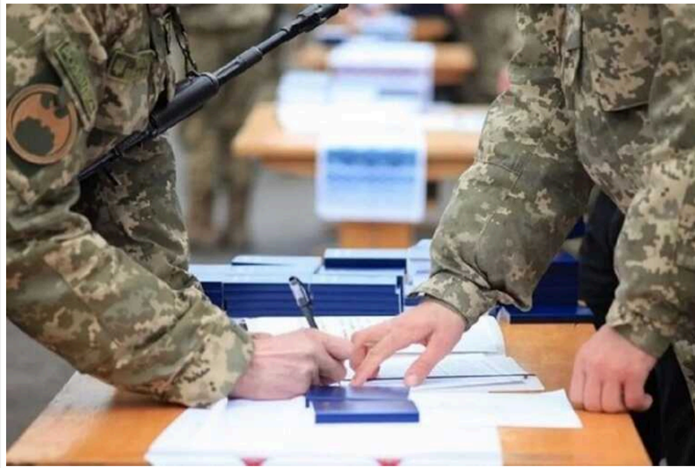
Посадовцям змінили правила бронювання від мобілізації

В Україні змінили правила бронювання чиновників від мобілізації. Зокрема, військовозобов'язані громадяни, які очолюють певні департаменти чи підрозділи, можуть бути призвані до армії.