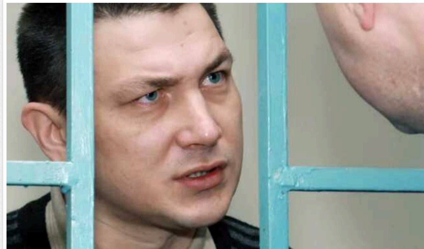
В Україні ліквідували спецназівця РФ, який вбивав мирних жителів ще у Чечні

Російські ЗМІ пишуть, що в Україні ліквідували капітана спецназу ГРУ Едуарда Ульмана, якого звинуватили в розстрілі мирних жителів у Чечні. Він переховувався від правосуддя 17 років.