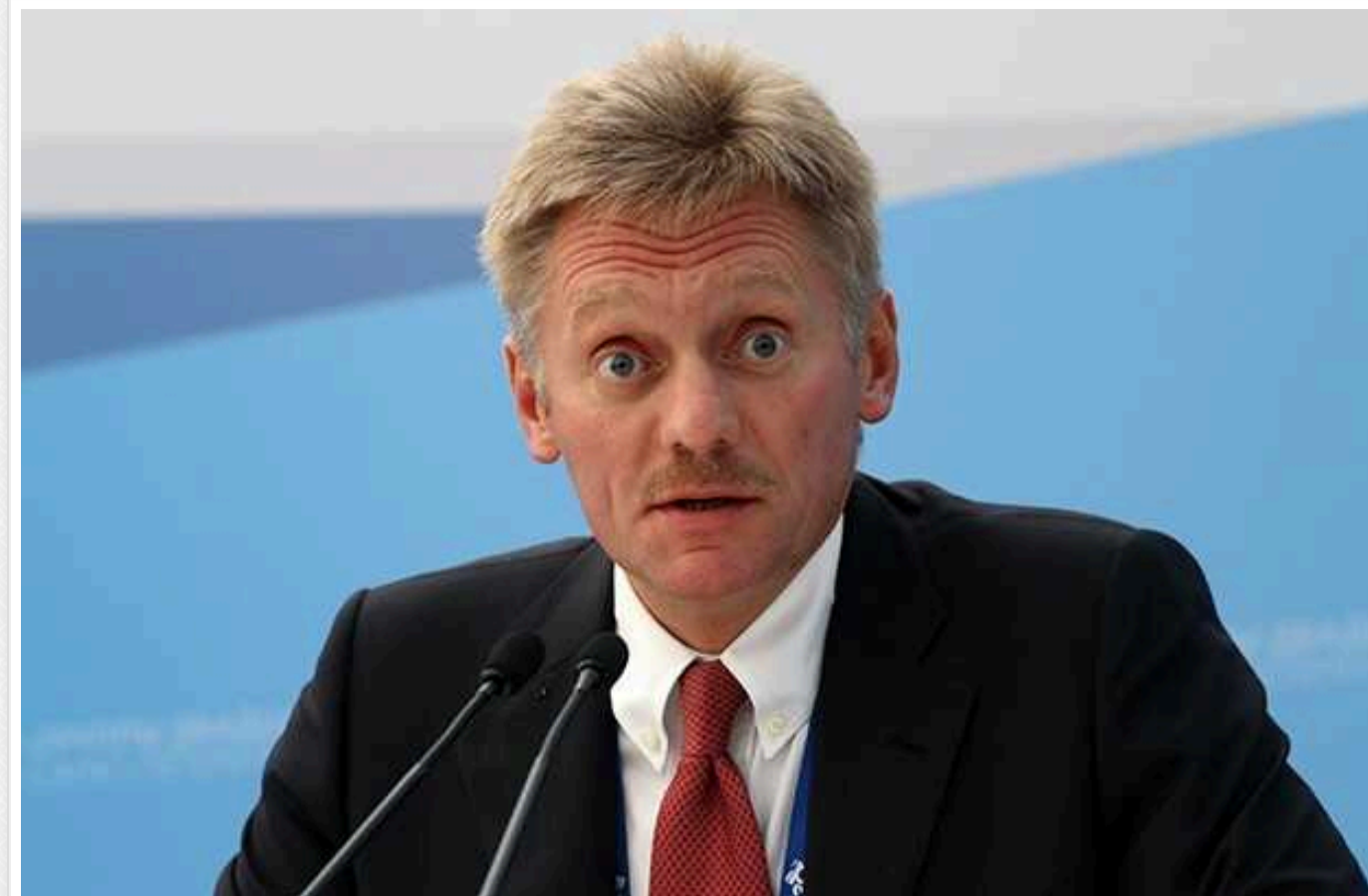
У Кремлі відреагували на заяви Макрона та Кемерона про війська в Україні й удари по РФ

У Кремлі влаштували нову істеріку через заяви західних партнерів України з приводу російської агресії. Так, цього разу керівництво РФ обурилося тим, що у Великій Британії вважають можливими удари по території РФ британською зброєю.