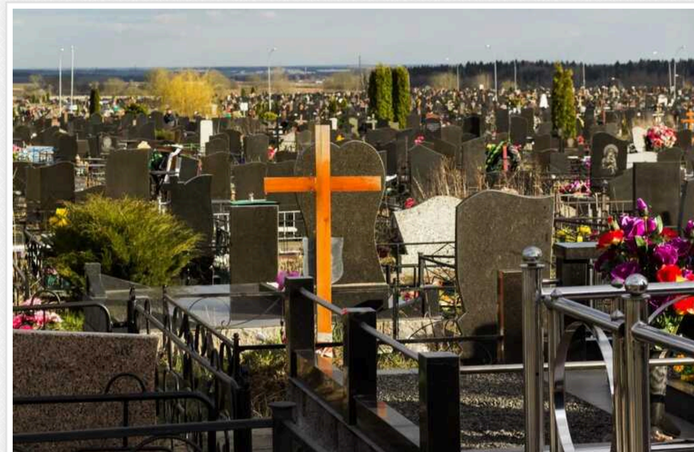
У столиці судитимуть доглядача Жулянського кладовища: вимагав 3000 доларів за "бронь" місця для поховання

У Києві судитимуть доглядача Жулянського кладовища, який за хабар "бронював" місце на цвинтарі у покинутій могилі, за якою вже ніхто не доглядає. Свої "послуги" зловмисник оцінив у 3 тисячі доларів США.