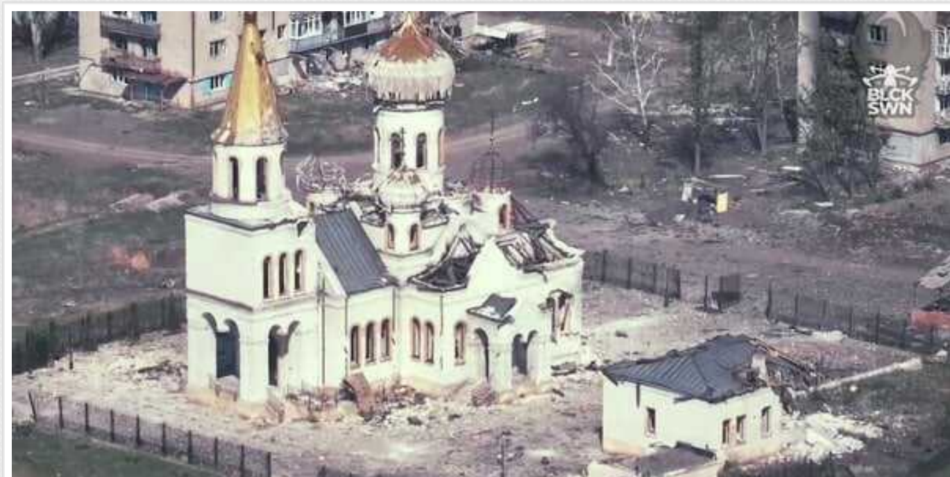
В ГУР заявили про загрозу "падіння" Часового Яру

Російські війська активно продовжують наступ на Часів Яр Донецької області, сподіваючись захопити його до 9 травня.