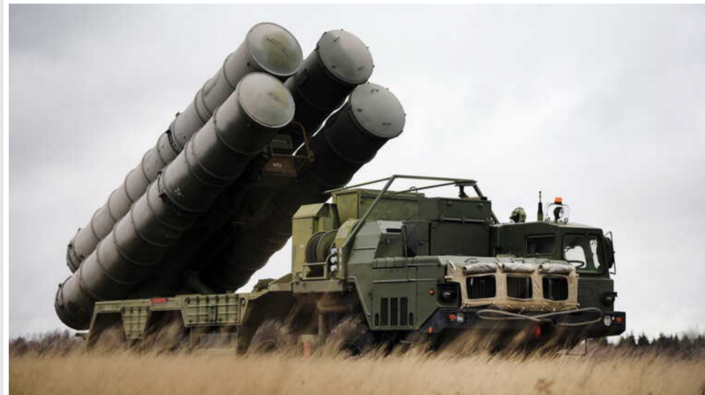
У Туреччині відмовилися передати ЗРК "Тріумф" Україні

Україна не отримає від Туреччини зенітно-ракетні комплекси (ЗРК) С-400 "Тріумф", які були закуплені у РФ.