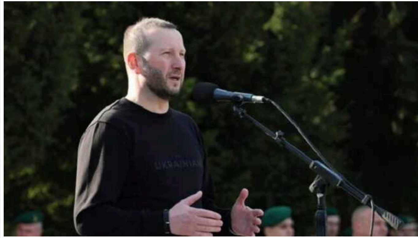
Зеленський призначив нового голову Хмельницької ОДА