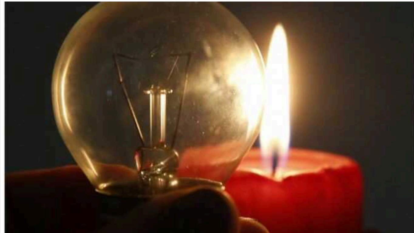
Відключення світла в Україні: графіки на Харківщині та аварія у Києві

В Україні 3 травня запроваджено графіки відключень електроенергії в Харківській області. Також продовжують діяти обмеження на промисловість у Кривому Розі. Окрім того, без світла у Києві залишалося понад 13 тис. абонентів. На Одещині заживили всіх побутових споживачів, знеструмлених після ракетного удару.