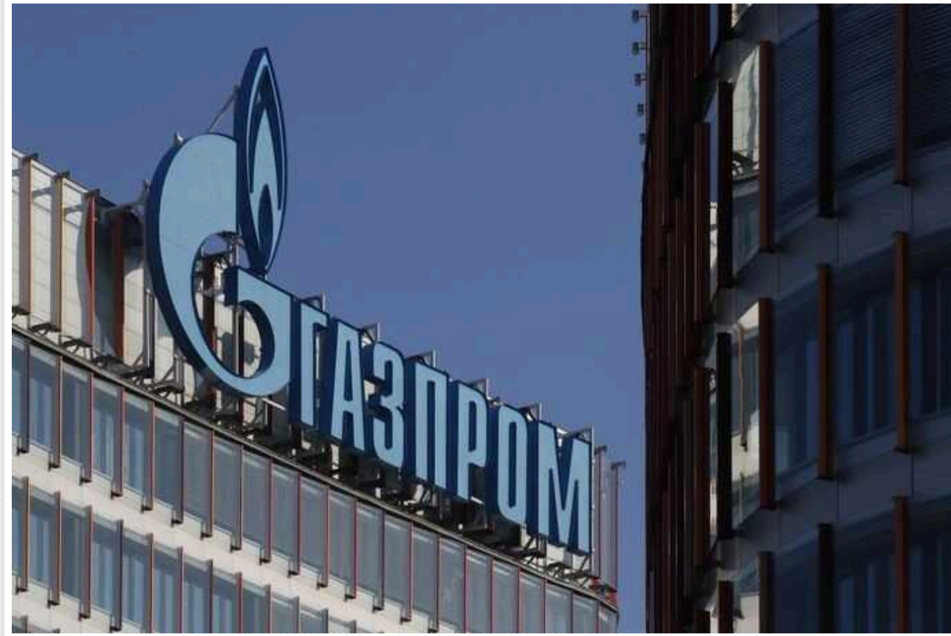
«Газпром» показав величезні збитки в 2023 році: це найгірший результат в історії Росії

Російський газовий гігант "Газпром" показав чистий збиток у 629 млрд рублів (6,8 млрд доларів) за підсумками 2023 року. Це не лише перший збиток компанії з післядефолтного 1999 року, а й найгірший її результат в історії. За півроку до цього ватажок Кремля Володимир Путін говорив, що "Газпром" почуватиметься впевнено.