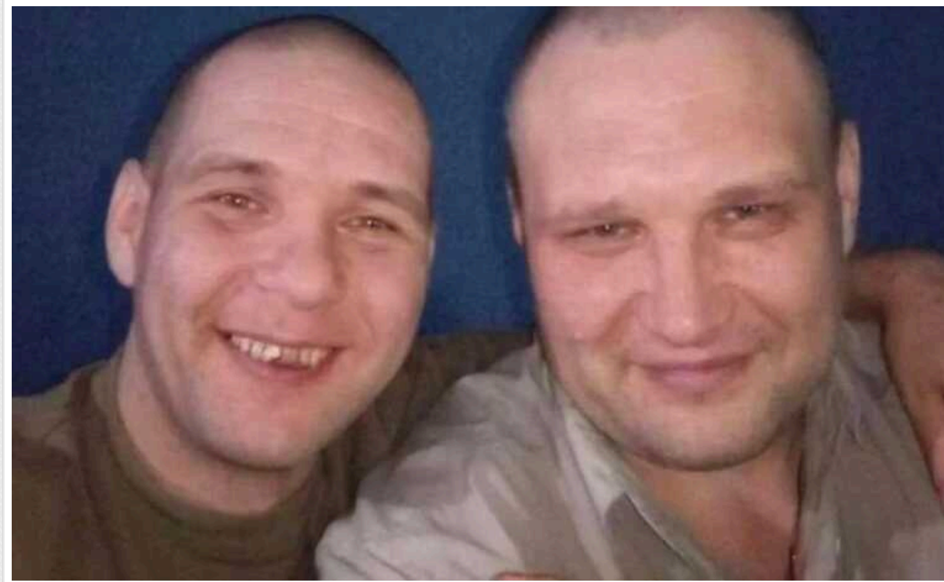
Засуджені в Росії розчленовувач і людоджер зустрілися на війні в Україні

Завдяки амністії Путіна, лави ЗС РФ поповнюють сотні й тисячі сучасних "послідовників" Чикатило. Вони "б'ються" за "дострокове звільнення" після пів року "служби". І роблять спільне селфі.