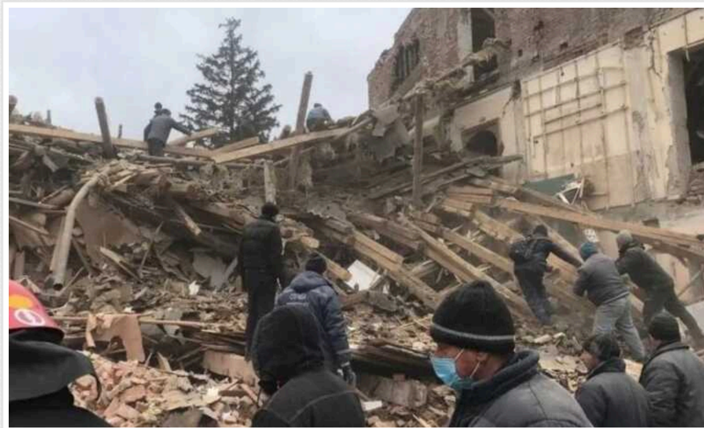
Заморожені російські активи не перекриють усіх потреб України, - Пишний

Голова Національного банку зазначив, що Україна розглядає суму заморожених російських активів як джерело покриття збитків, які були завдані агресією.