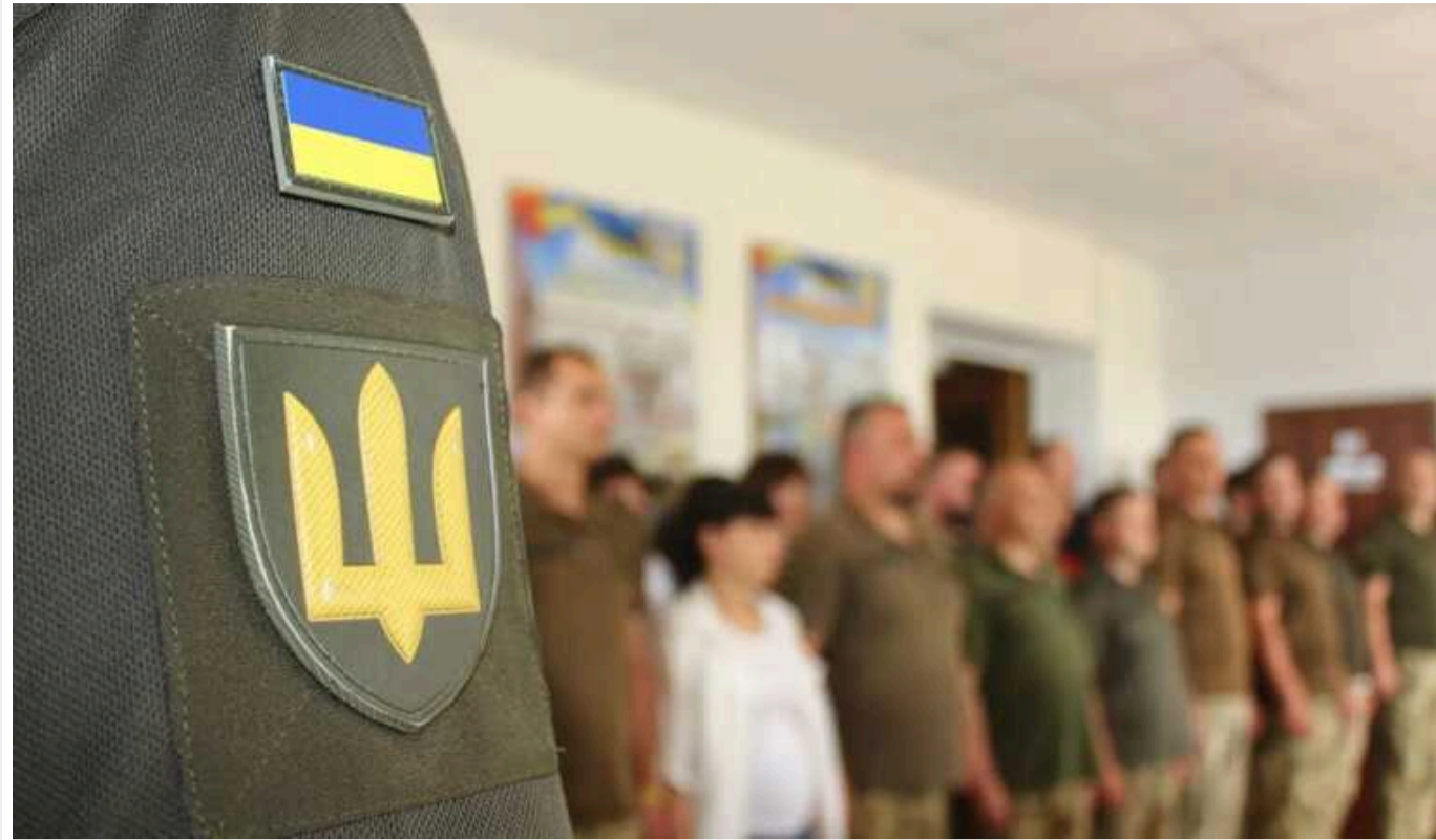
Українцям пояснили, чи потрібно йти до ТЦК, якщо вони вже оновили дані

Оновлення даних - це обов'язок кожного військовозобов'язаного українця. Якщо громадяни зробили це до набуття чинності нового Закону про мобілізацію (18 травня), то знову йти до ТЦК їм не потрібно.