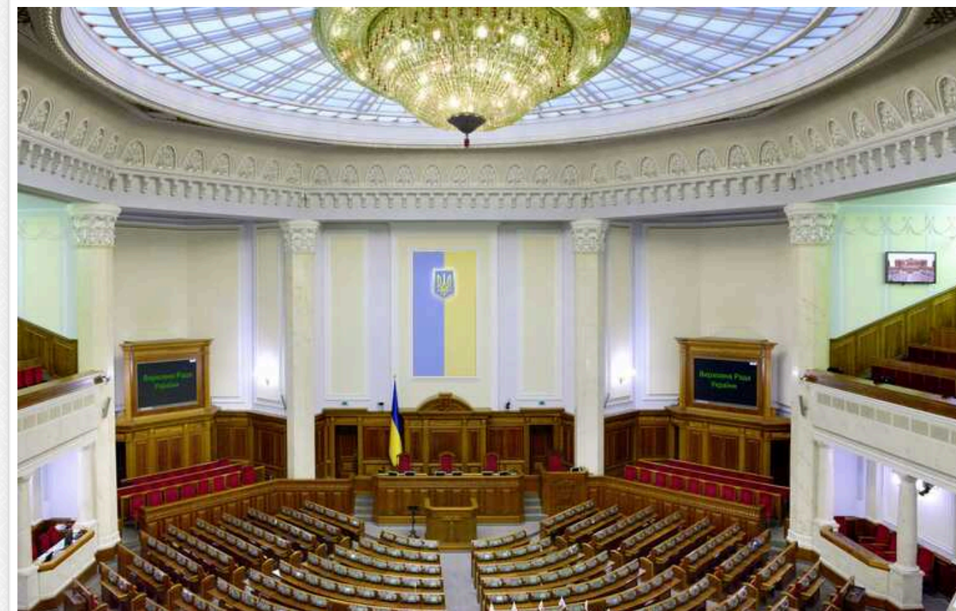
ВР планує заборонити публікувати в реєстрі судові рішення стосовно мобілізації, військовослужбовців та військового обліку

Незбаром практика судів стосовно мобілізації та виконання військового обов'язку може бути закрита для громадськості. Відповідний законопроект №7033-д готується прийняти Верховна Рада.