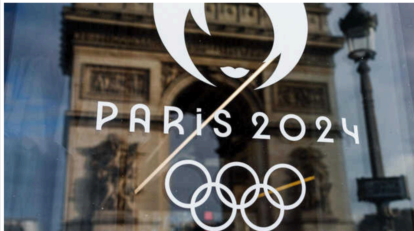
Мінспорту та НОК опублікували рекомендації для українських спортсменів, як поводитися з росіянами та білорусами на ОІ-2024 у Парижі