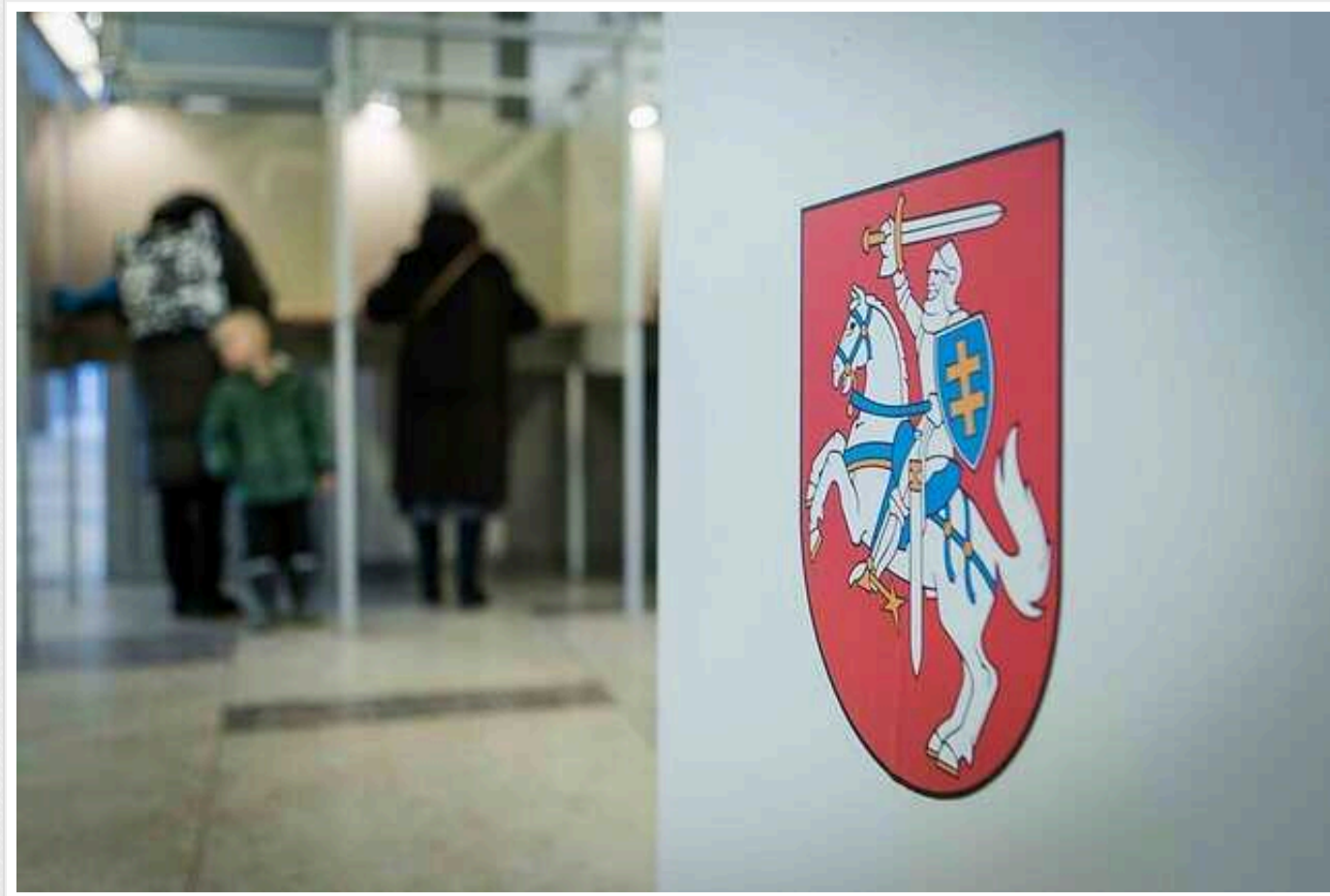
Вибори у Литві: за два тижні до виборів у країні "просіла" підтримка чинного президента

Менш як за два тижні до виборів президента у Литві рейтинг чинного глави держави Гітанаса Науседи відчутно знизився.