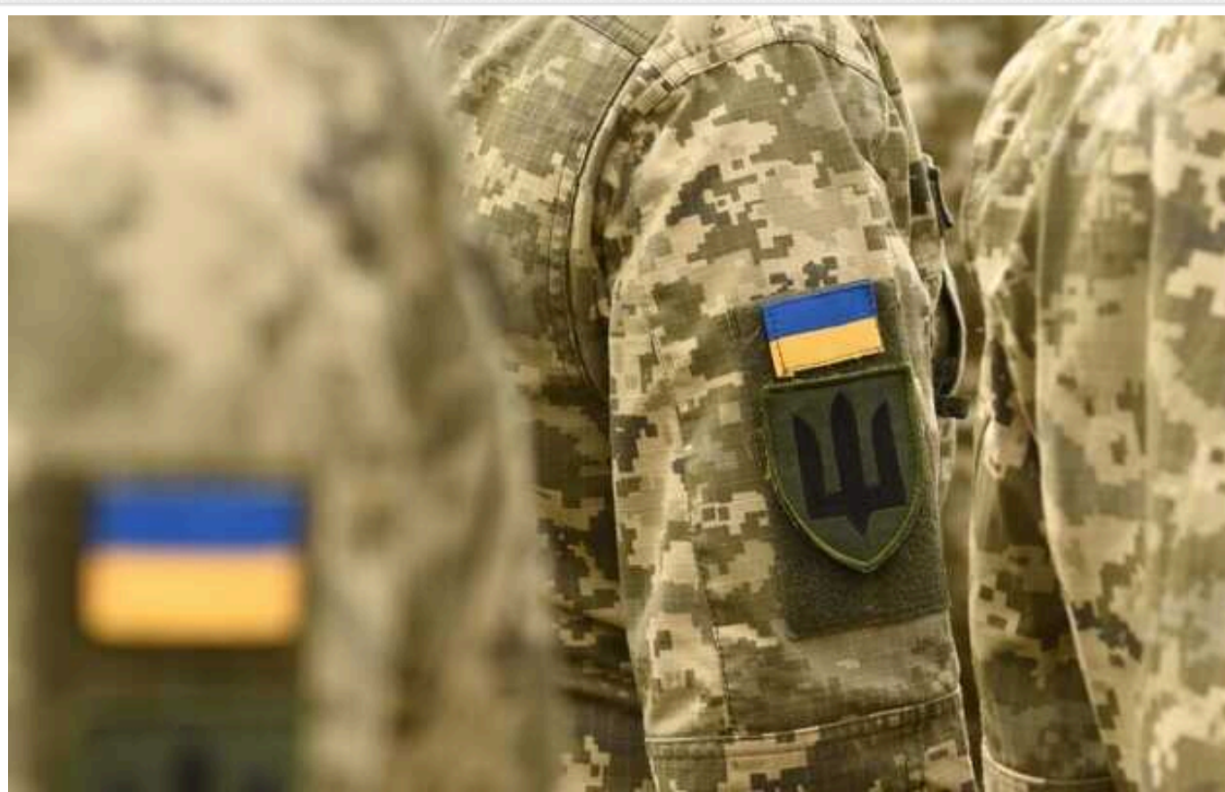
Мобілізаційний потенціал за ґратами: залучення ув'язнених до військової служби за контрактом

Захист Батьківщини під час війни — це обов'язок чоловіків, але водночас це ще і право громадян України боронити свою землю від ворога. Чи можуть засуджені до позбавлення волі реалізувати це право і за яких умов?