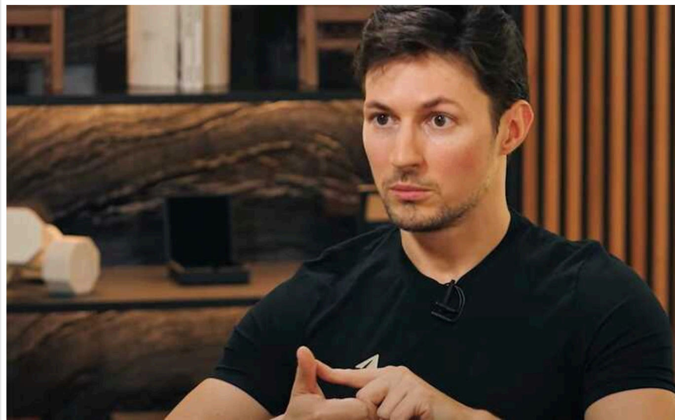
Творець Telegram Дуров розповів, що вільно розуміє українську мову

Творець месенджера Telegram Павло Дуров розповів, що родина його матері родом з України, а сам він вільно розуміє українську мову.