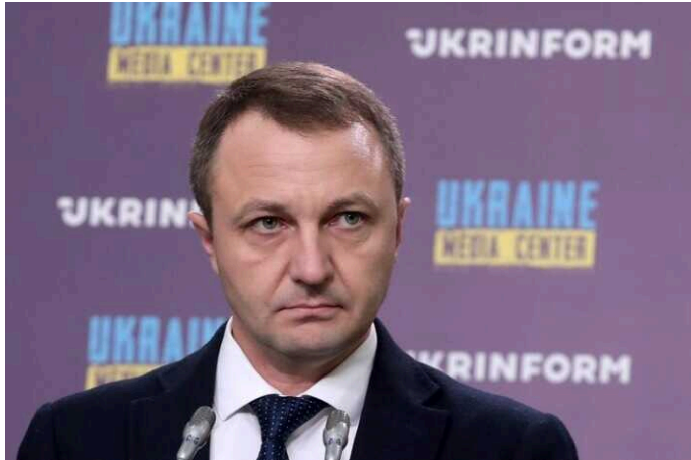
П'ята частина дошкільнят не розуміють української мови, – омбудсмен Кремень

Влітку минулого року, згідно зі статистикою, в Україні працювало 10 863 дитсадки, в яких загалом виховувалося 934 355 дітей.