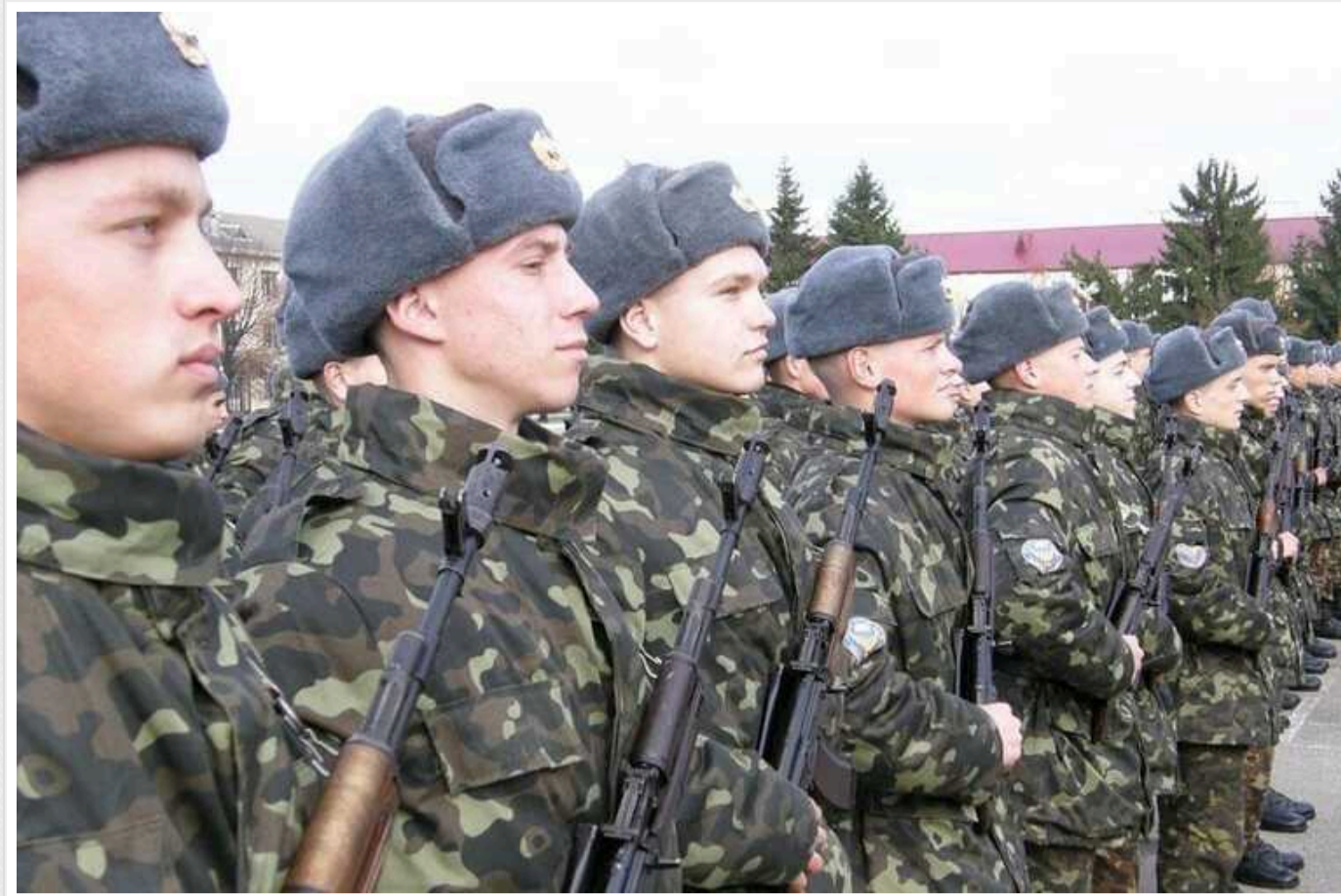
Який Президент України позбавився найбільшої кількості ЗРК та ракет, – дослідження

Українські збройні сили втратили найбільшу кількість танків за часів президента Віктора Януковича. За часів президента Віктора Ющенка максимально зменшилася кількість літаків та гелікоптерів.