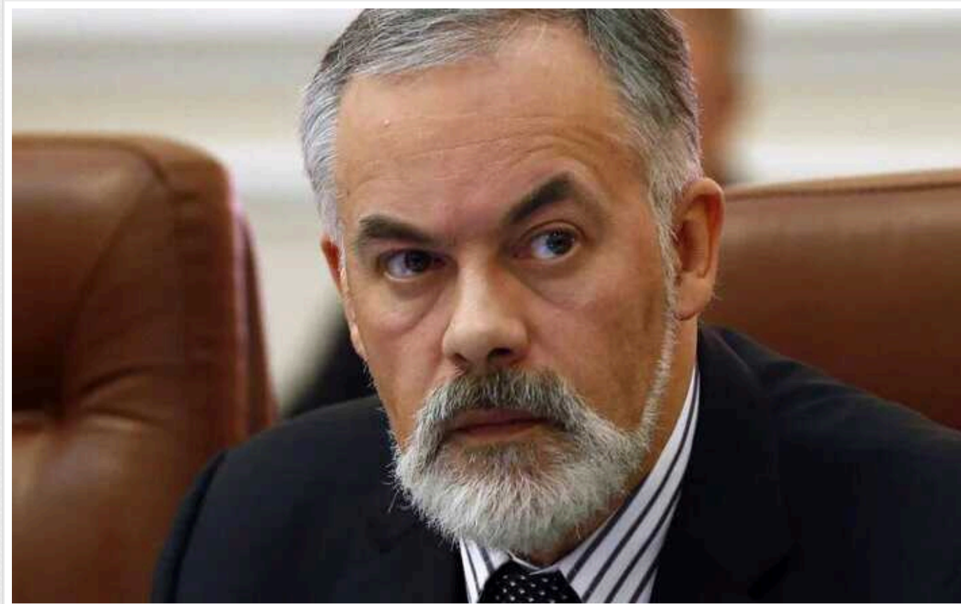
Майно ексміністра освіти Табачника перейшло в управління ФДМ

Майно проросійського ексміністра освіти України Дмитра Табачника перейшло в управління Фонду державного майна.