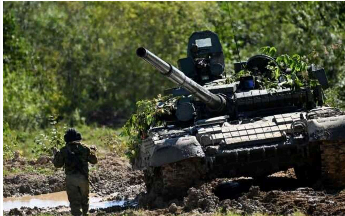
Forbes пише про великі втрати 47-ої бригади ЗСУ: багато солдатів, 40 МБП Bradley, 5 танків Abrams

Видання Forbes пише, що 47-а бригада ЗСУ зазнала дуже великих втрат у солдатах, а також втратила 40 МШП Bradley та 5 танків Abrams.