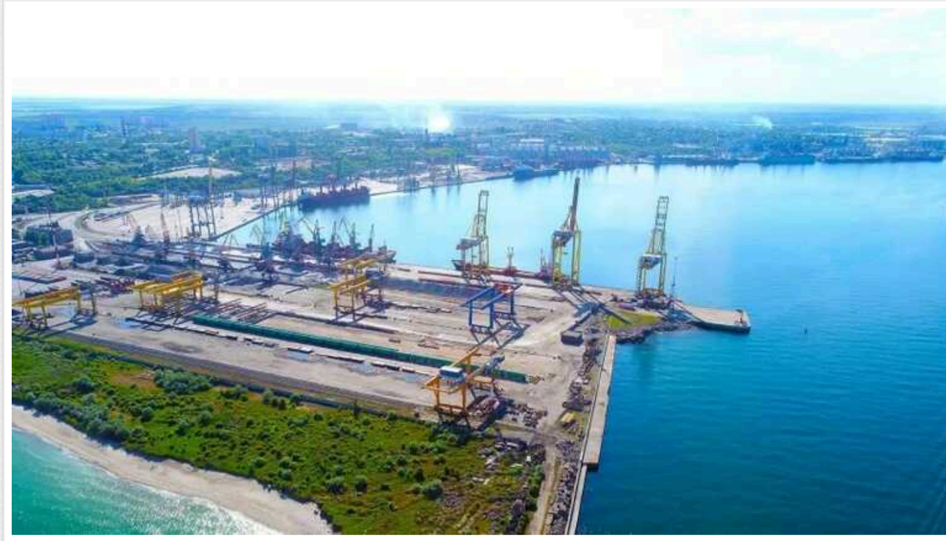
Схема Шатворяна та Авакова у Чорноморському порту: НАБУ оголосило підозри

НАБУ оголосило перші підозри у схемі, яку організували у Чорноморському торговому порту екснардеп Вілен Шатворян та ексміністр МВС Арсен Аваков. Мова йде про діяльність компанії «Європiан Агро Інвестмент Юкрейн».