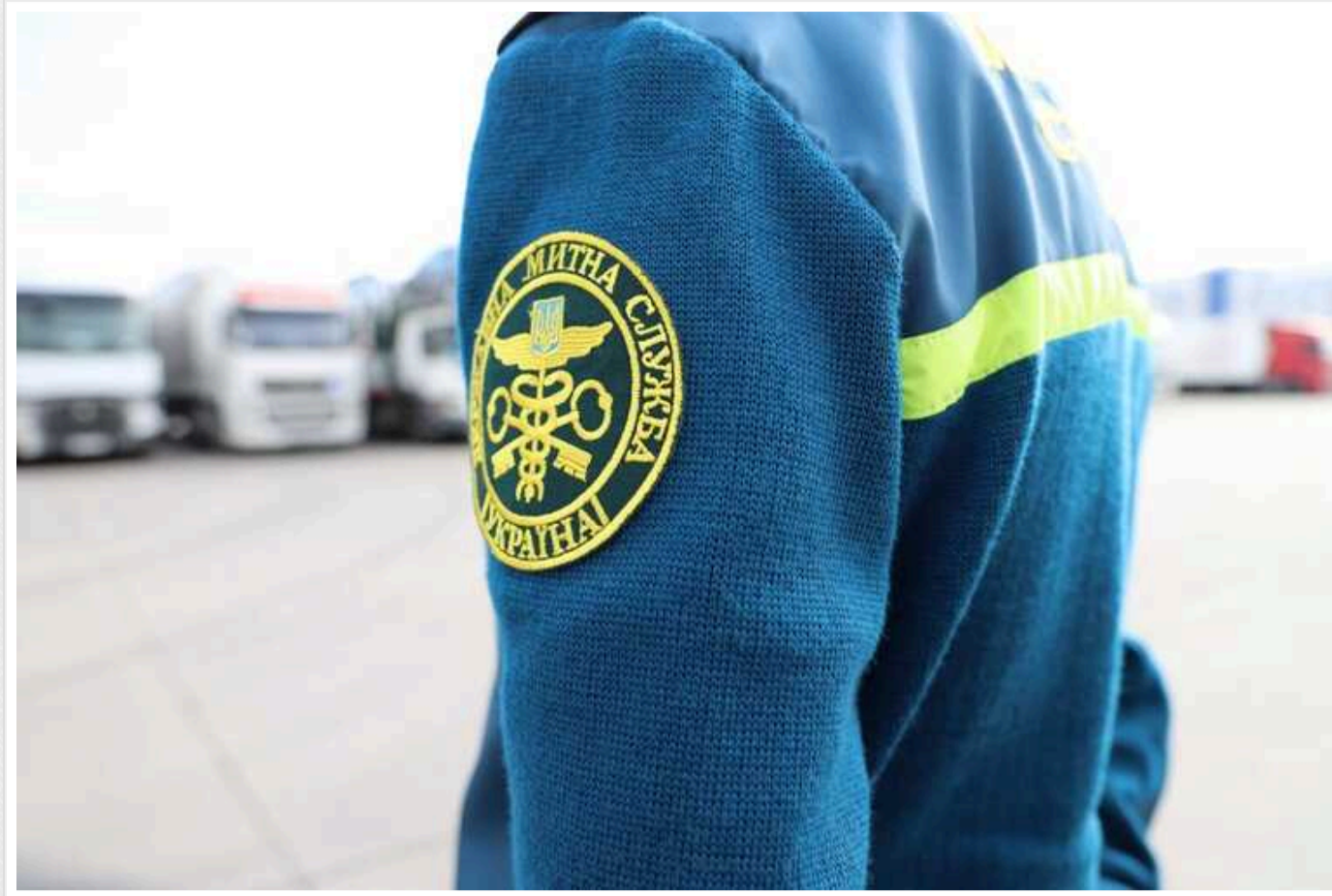
Нова схема на митниці: імпортували брендові речі за цінами дешевшими за секонд-хенд

Українські продавці брендovих речей імпортували брендові речі за цінами дешевшими за секонд-хенд. У країні вони продавали одяг за вартістю, що в сотні разів перевищувала вказану у декларації.