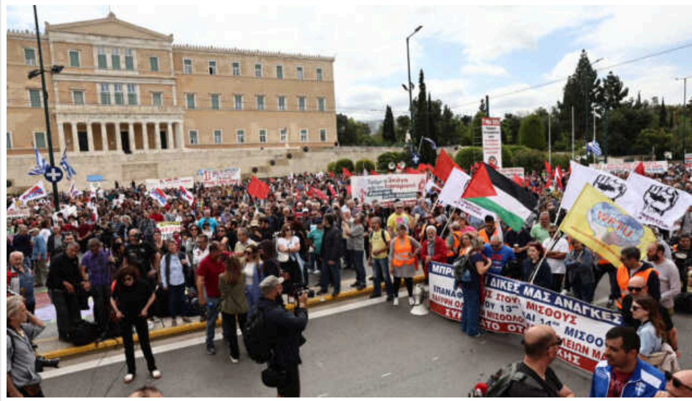
Протести в Афінах: мітингувальники вимагають підвищення зарплат і припинення війни в Газі

У столиці Греції Афінах сотні робітників пройшли в середу маршем, вимагаючи підвищення заробітної плати, а також протестуючи проти війни в секторі Гази. Про це повідомляє Ekathimerini .