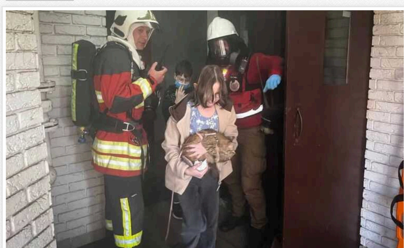
Під Києвом сталася пожежа в багатоповерхівці: з будинку евакуювали 84 осіб

У Вишгороді Київської області у вівторок, 30 квітня, сталась пожежа на 18-му поверсі 22-поверхового житлового будинку. Під час гасіння вогню біля ДСНС евакуювали 84 осіб, з яких 20 – діти.