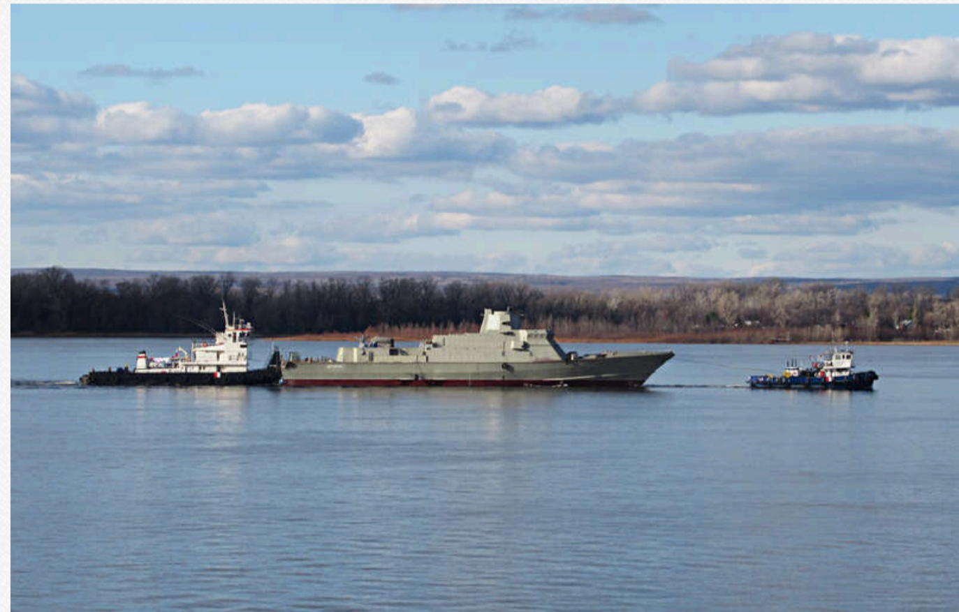
Проведення МРК проекту "Каракурт" по річках у РФ

Зазначимо, що завдяки мережі річок та каналів у РФ є можливість посилення та перекидання кораблів таких класів фактично до будь-якого флоту та флотилії, можливо окрім Тихоокеанського. На практиці, кораблі із Зеленодольського заводу на постійній основі посилювали російські Чорноморський, Балтійський флоти та Каспійську флотилію.