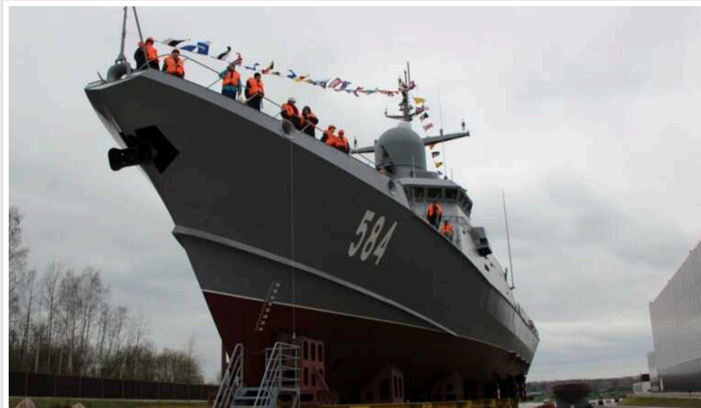
Росія готує до спуску на воду два кораблі для Чорноморського флоту, один з них – носій ракет «Калібр»

Найближчим часом у РФ має відбутись спуск на воду двох кораблів, які призначені для Чорноморського флоту: малога ракетного корабля проекту 22800 "Каракурт", який має назву "Тайфун" та патрульного корабля проекту 22160 типу "Василь Биков", який має назву "Віктор Великий", пише Defense Express.