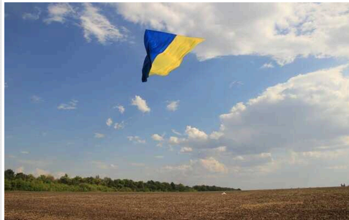
НАТО може закрити небо на заході України, – ексміністр Польщі Онишкевич

Союзники НАТО могли б збивати російські ракети, що летять в напрямку Польщі, над територією України. Для цього потрібні політичні рішення на рівні НАТО й України, а також повний доступ союзників до інформації щодо ситуації у повітряному просторі України.