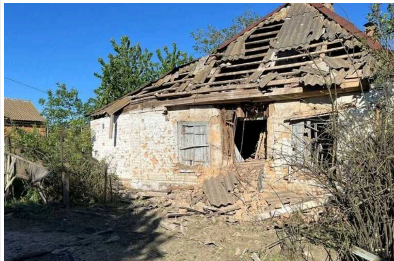
Окупанти за минулу добу п'ять разів обстріляли Нікопольщину з артилерії

30 квітня росіяни 8 разів атакували Нікопольський район Дніпропетровської області артилерією та дронами.