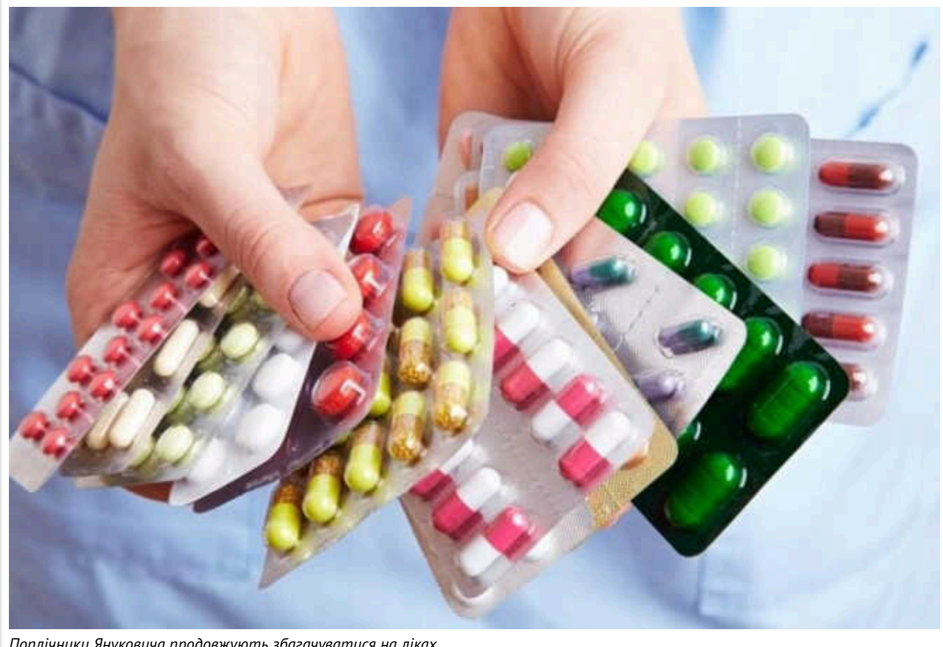
Поплічники Януковича продовжують збагачуватися на ліках