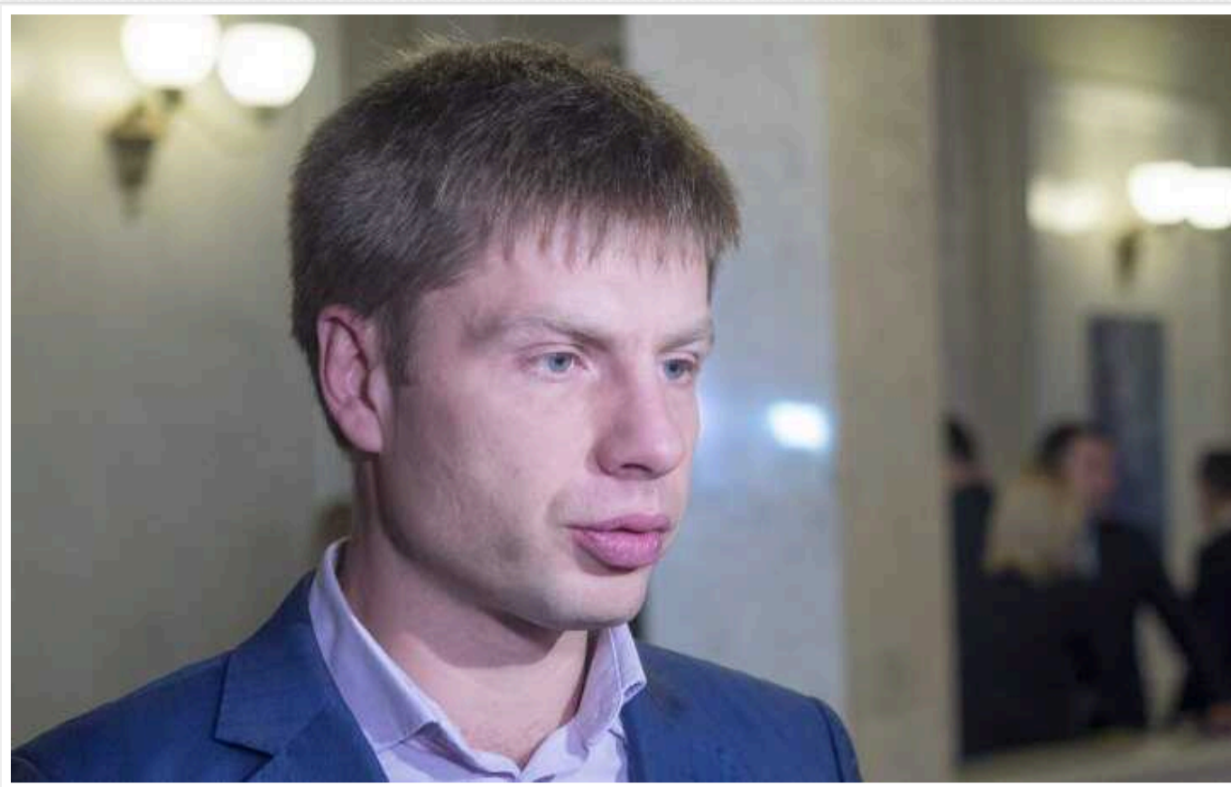
У РФ оголосили у розшук нардепа Гончаренка

Міністерство внутрішніх справ Росії оголосило в розшук народного депутата Олексія Гончаренка.