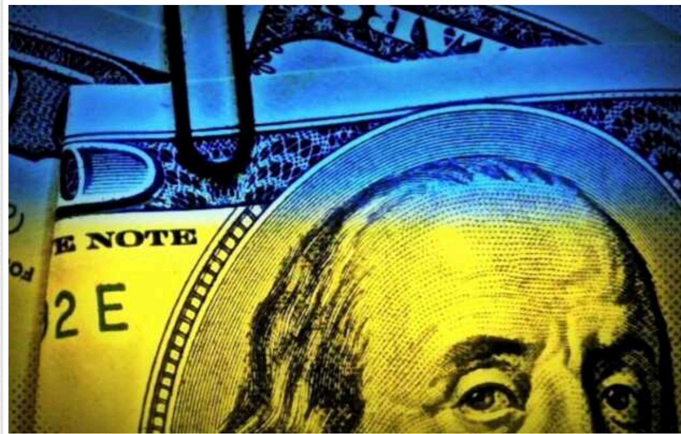
Через падіння гривні зріс держборг України

Про це повідомляє голова податкового комітету Гетманцев.